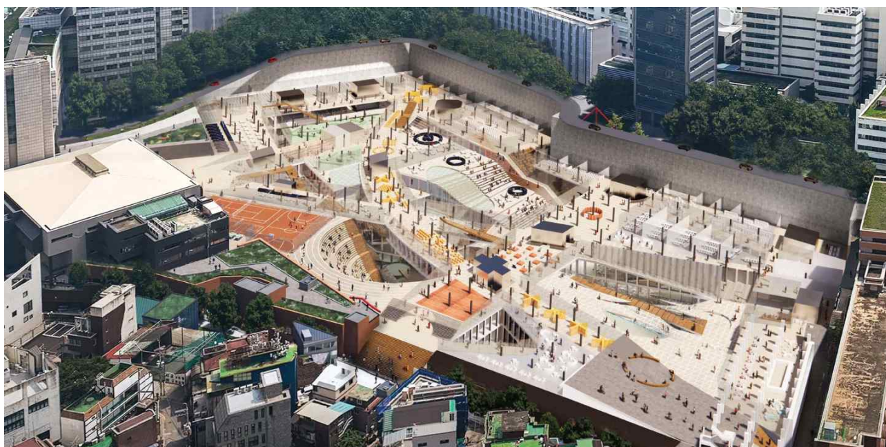
<Composite Campus Complex Layout>